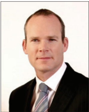
Simon Coveney An tAire Cosanta

Cuirim fáilte roimh fhoilsiú an Ráitis Straitéise seo i mo cháil mar Aire Cosanta. Cuireann an Ráiteas creatlach straitéiseach ar fáil don Roinn Cosanta agus d'Óglaigh na hÉireann sa chéad trí bliana eile. Rinneadh freagairt leanúnach agus tiomanta ar na dúshláin a chuir COVID-19 roimh an Eagraíocht Chosanta. Chuaigh an fhreagairt sin go mór chun tairbhe Fheidhmeannacht na Seirbhíse Sláinte (FSS) agus codanna eile den Stát atá ag dul i ngleic leis an bpaindéim seo ó lá go lá. Tá an Ráiteas Straitéise seo á fhoilsiú ag tráth an-tábhachtach don Eagraíocht Chosanta: tá an Coimisiún maidir le hÓglaigh na hÉireann á bhunú agus déanfar Athbhreithniú ar Chumas Eagraíochta na Roinne Cosanta go luath. Mar sin, táthar ag súil leis go ndéanfar athbhreithniú meántearma ar an Ráiteas Straitéise seo. Ar an iomlán, soláthraíonn an Ráiteas Straitéise clár oibre dúshlánach atá ag teacht le tábhacht na cosanta don fholláine náisiúnta. Táim ag tnúth le bheith ag obair go dlúth i gcomhar leis an Ard-Rúnaí, an Ceann Foirne agus a bpearsanra faoi seach, idir sibhialta agus mhíleata, a mbeidh a n-iarrachtaí le chéile ag teastáil chun an sprioc ardleibhéil Cosanta a bhaint amach.