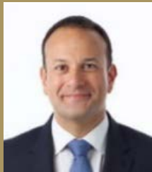
Leo Varadkar T.D. An Tánaiste agus an tAire Fiontar, Trádála agus Fostaíochta