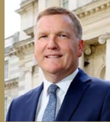
Michael McGrath T.D.

Beidh ról riachtanach ag an NDP maidir lenár bhfreagairtí a mhúnlú do dhúshláin an lae inniu, chomh maith le muid a ullmhú do dhúshláin amach anseo. Cinnteoidh sé cur i bhfeidhm an NPF trí leibhéal infheistíochta a bheith go maith os cionn mheán an AE. Is ionann é freisin agus athrú suntasach i ngealltanas an Rialtais d'aistriú chuig sochaí ísealcharbóin atá seasmhach in aghaidh na haeráide, agus tá socruithe láidrithe rialachais san áireamh ar mhaithe le bheith ag díriú ar sheachadadh bonneagar poiblí atá éifeachtach agus cost-éifeachtúil araon.