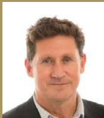
Eamon Ryan T.D. An tAire Comhshaoil, Aeráide, Cumarsáide agus Iompair