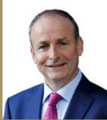
Micheál Martin T.D. An Taoiseach

Soláthraíonn an NDP seo an fhís mhionsonraithe dhearfach sin d'Éirinn thar na 10 mbliana atá romhainn. Le chéile, tá sraith comhchuspóirí straitéiseacha cruthaithe againn chun rathúnas a dhaingniú dár dtír, dár réigiúin agus dár ndaoine amach sa todhchaí. Beimid ag díriú anois ar a chinntiú go ndéanfar an plean a sheachadadh go tapa éifeachtach.